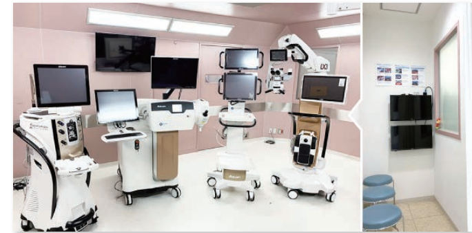
手術室/手術見学室

最新鋭の手術装置、検査装置を導入し、より安全で高度な手術をご提供できるよう努めています。